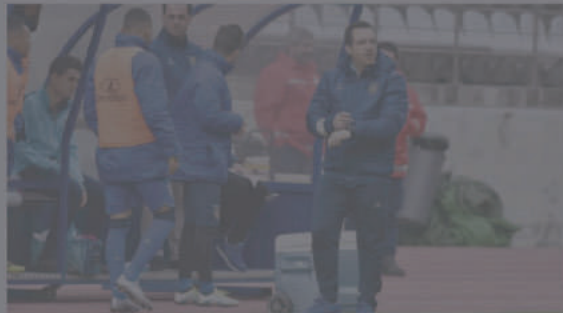
União tem ainda quatro treinos agendados antes de receber o Arouca.

Em mais uma partida difícil, pela frente, o técnico tem ainda agendadas quatro sessões de trabalho, com vista a ter um grupo cada vez mais forte de forma a regressar aos triunfos. De referir que o duelo com o Arouca está marcada para as 16 horas de sábado, na Ribeira Brava.