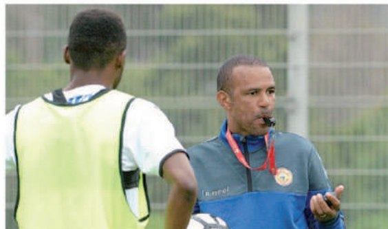
Nacional continua a preparar a deslocação ao reduto do Sporting B.

■ Amir não jogou pelo Irão, na derrota da selecção de Carlos Queirós frente à Tunísia. O Irão, que vai estar no 'mundial', volta a jogar hoje, agora frente à Argélia, em jogo que se realizará na Áustria.