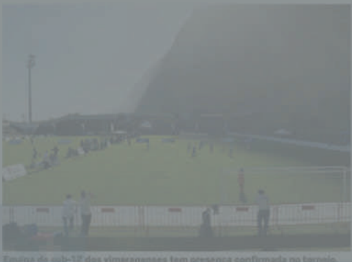
Equipa de sub-12 dos vitimenses tem presença confirmada no torneio.

O São Vicente Cup 2018, que é disputado nos escalões de sub-8, sub-10 e sub-12, está então de volta com grandes novidades, numa organização da Câmara Municipal de São Vicente e Associação Cultural e Desportiva de São Vicente.