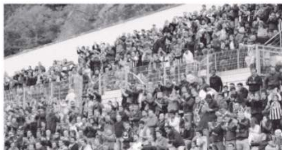
Adeptos alvinegros compareceram em grande número na Ribeira Brava.

treinando ontem à porta fechada, na Camacha, protagonizando uma sessão de trabalho no período da manhã. Hoje, os nacionalistas voltam a treinar, às 16h00, no Estádio da Madeira, novamente à porta fechada, preparando um embate decisivo frente ao Santa Clara, 2.º classificado, com 56 pontos, enquanto o Nacional totaliza no momento 62, na liderança do campeonato. JM