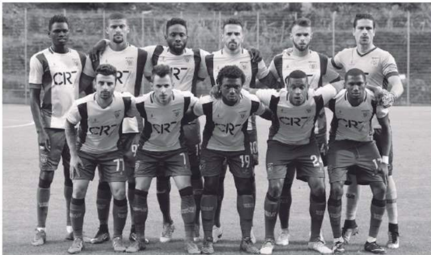
União corre sérios riscos de perder mais de 600 mil euros se descer ao Campeonato de Portugal.

Segundo conseguimos apurar, o Governo Regional até poderá reduzir as verbas que estão destinadas para este capítulo, em poucos pontos percentuais, por força da redução do número de clubes, de três para dois, sem penalizar o Marítimo, para quem foi destinado esta época 1.848.086,80 euros, valorizando o Nacional, que tem um