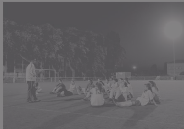
Seleção da Madeira de sub-16 vai estar na luta com outras 17 representações.

A final da competição está agendada para domingo, às 12h15.