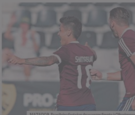
MATADOR. Brasileiro festejou duas vezes frente à Oliveirense

O Cova da Piedade, de resto, não deixou passar a efemeridade e presenteou o brasileiro de as-